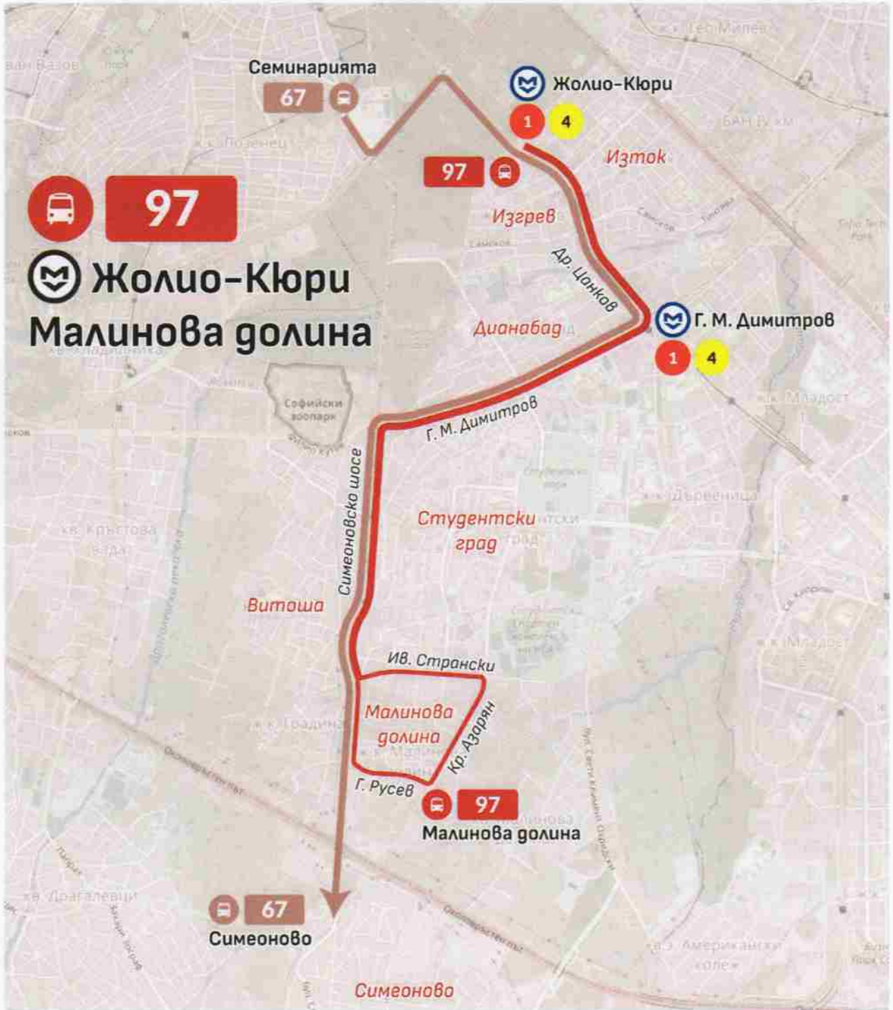
Приложение 2: Маршрут на автобусна линия № 97