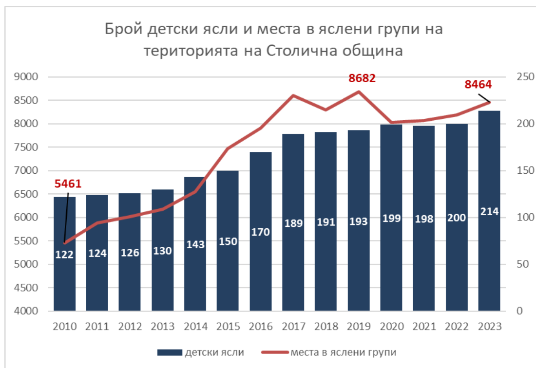
Фиг. 2. Брой детски ясли и места в яслени групи на територията на Столична община в периода 2010-2023 г.

достъпността на услугата. На територията на Столична община живеят около 25 хил. деца, които са навършили възраст от 1 година, но все още не са навършили възраст 3 години. Това означава, че към момента капацитетът на системата осигурява места за около 1/3 от децата. Същевременно, политиката на социално подпомагане и обезщетения в страната, фактически насърчава жените да се върнат на работа след първата година на майчинството. По този начин, несъмнено се поражда обществени напрежения и Столична община трябва да помисли или за много по-високи допълнителни социални помощи (които да компенсират втората година на майчинството до размера на обезщетенията от първата година на майчинството) или да се работи и за откриването на повече яслени групи или техни социални алтернативи. И в този случай обаче е редно да се каже, че като цяло институционалната ситуация в Столична община не се различава съществено от тенденцията за страната, напротив, към 2023 г. обхватът на деца в яслени групи на територията на Столична община е с около 4 процентни пункта по-висок от средните нива на обхват в страната.