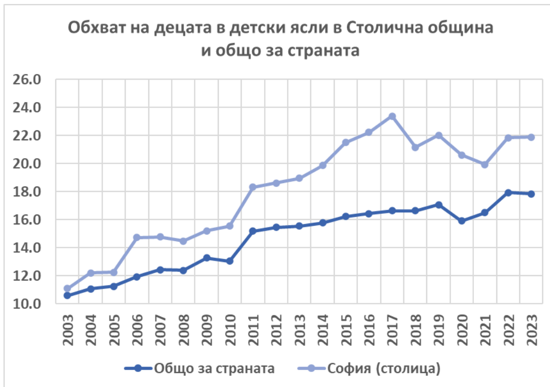
Фиг. 2. Обхват на децата в детски ясли в Столична община и общо за страната в периода 2003-2023 г.