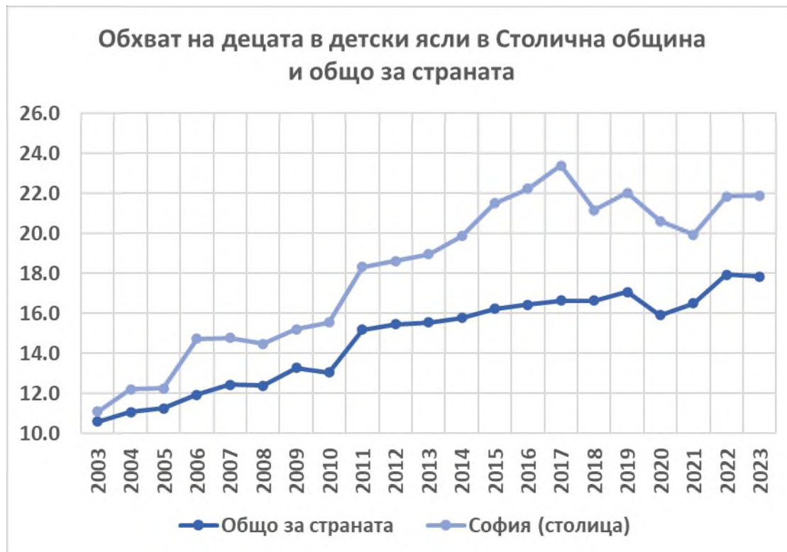
Фиг. 2. Обхват на децата в детски ясли в Столична община и общо за страната в периода 2003-2023 г.