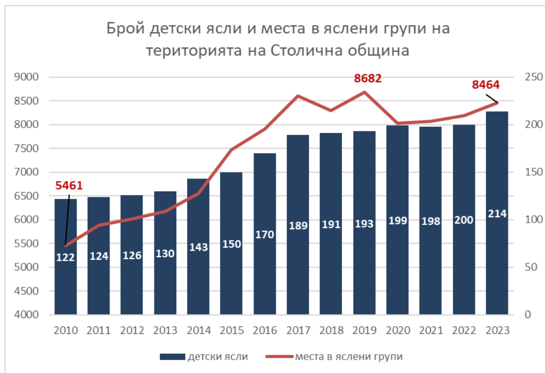
Фиг. 2. Брой детски ясли и места в яслени групи на територията на Столична община в периода 2010-2023 г.

около 25 хил. деца, които са навършили възраст от 1 година, но все още не са навършили възраст 3 години. Това означава, че към момента капацитетът на системата осигурява места за около 1/3 от децата. Същевременно, политиката на социално подпомагане и обезщетения в страната, фактически насърчава жените да се върнат на работа след първата година на майчинството. По този начин, несъмнено се пораждат обществени напрежения и Столична община трябва да помисли или за много по-високи допълнителни социални помощи (които да компенсират втората година на майчинството до размера на обезщетенията от първата година на майчинството) или да се работи и за откриването на повече яслени групи или техни социални алтернативи. И в този случай обаче е редно да се каже, че като цяло институционалната ситуация в Столична община не се различава съществено от тенденцията за страната, напротив, към 2023 г. обхватът на деца в яслени групи на територията на Столична община е с около 4 процентни пункта по-висок от средните нива на обхват в страната.