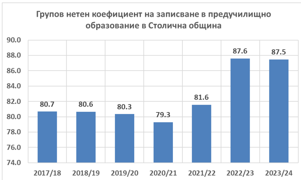
Фиг 1. Групов нетен коефициент на записване в предучилищно образование в Столична община

Данните за коефициента на записване в предучилищното образование показват, че след спад от приблизително 1,5% пункта по време на пандемията от Ковид-19, към момента се наблюдава значим ръст до 87,5-87,6%. Този коефициент се изчислява като съотношение на броя на учащите в предучилищното образование във възрастовата група 3-6 години към броя на цялото население в същата възрастова група. Наблюдаваното значително увеличение в стойностите на този коефициент е следствие от националните образователни политики, защото в резултат от промените в Закона за училищното и предучилищното образование, приети през 2020 г., през 2023 г. изтича gratuitният период и общините следва да са осигурили нужния брой места в детските градини и в подготовителните групи в училищата за всички деца на възраст 4-6 г.