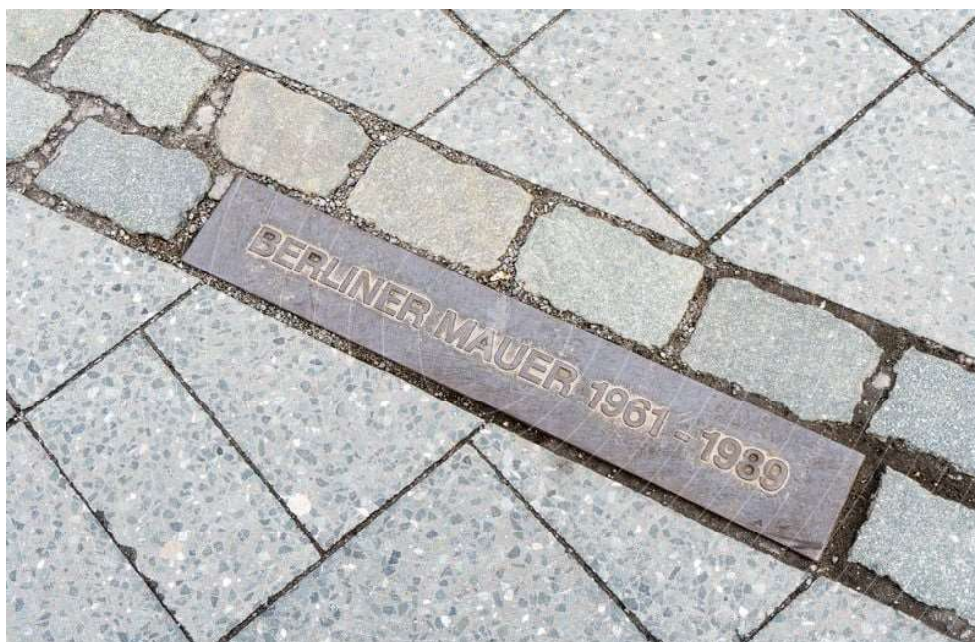
Фиг. 1 Маркер в тротоарна настилка, бележеш Берлинската стена

Въпреки това, растерът на настилката не е достатъчен сам по себе си, за да информира пешеходците, че тези акценти в него, бележат именно исторически контекст. Пример за подход, осигуряващ такъв, може да се намери в Берлин, където демонтираните отсечки от Берлинската стена са маркирани с два непрекъснати реда гранитни павета и метални плочи, поставени на регулярно разстояние една от друга в зоните, където силуета на Стената може да бъде възприеман от пешеходците. Така те дават информация, че Стената се е издигала на тази локация (Фиг. 1).