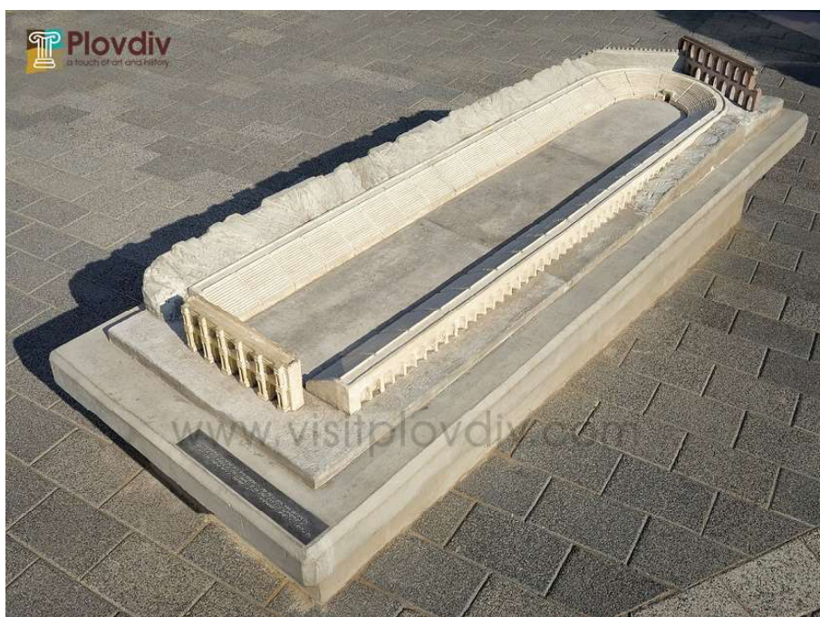
Фиг. 3 Макет на Пловдивския стадион на пл. Римски стадион

Пример за подобни макети, изложени in situ могат да се намерят както в чужбина, така и в България. Например на пл. Римски стадион в Пловдив е поместен макет на Пловдивския стадион (Фиг. 3), пресъздаващ в мащаб експонираните разкопки, както и допълнителни конструкции, загатнати в експонирания слой. Той е изработен от бетон, което го предпазва както от вандализиране, така и гарантира дълготрайност.