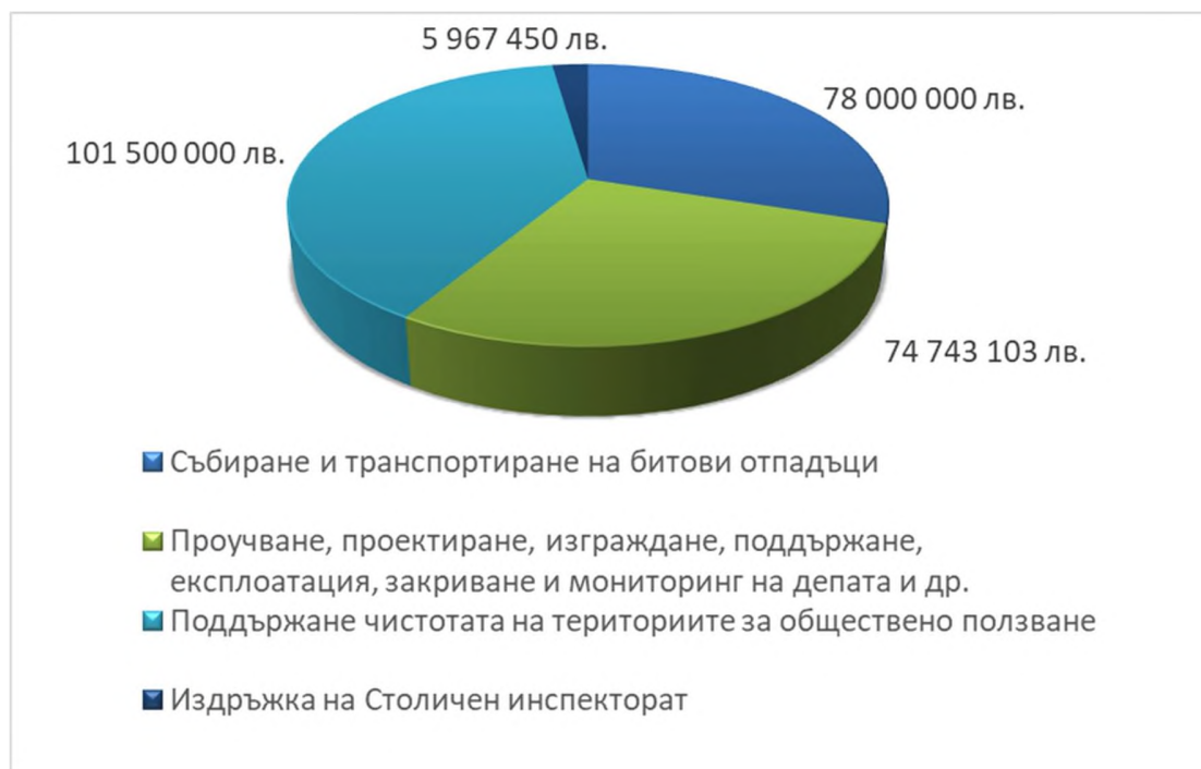
Фиг. 6. План-сметка на Столична община за 2023 г. по компоненти.

За финансовото осигуряване на пълния обем на дейностите по събиране, извозване и обезвреждане в депа или други съоръжения на битовите отпадъци, проектиране и изграждане на нови инсталации, както и за поддържане на чистотата на териториите за обществено ползване през 2023 г., са необходими средства в размер на 260 210 553 лв. (Приложение № 2, Приложение № 2А), разпределени както следва: