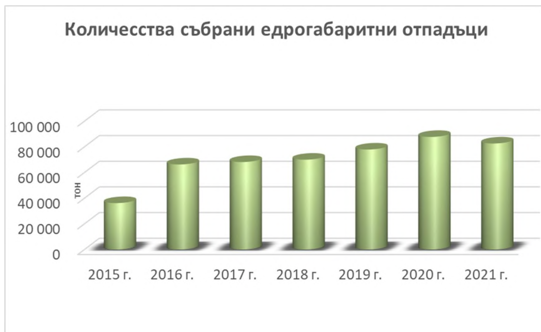
Фиг.4 Тенденция в количествата ЕГО за период 2015 - 2021 г.

2. Изпълнение на разходите за проучване, проектиране, изграждане, поддръжане, експлоатация, закриване и мониторинг на депата за битови отпадъци или други инсталации или съоръжения за обезвреждане, рециклиране и оползотворяване на битови отпадъци, включително отчисленията по чл. 60 и 64 от ЗУО към 30.09.2022 г.