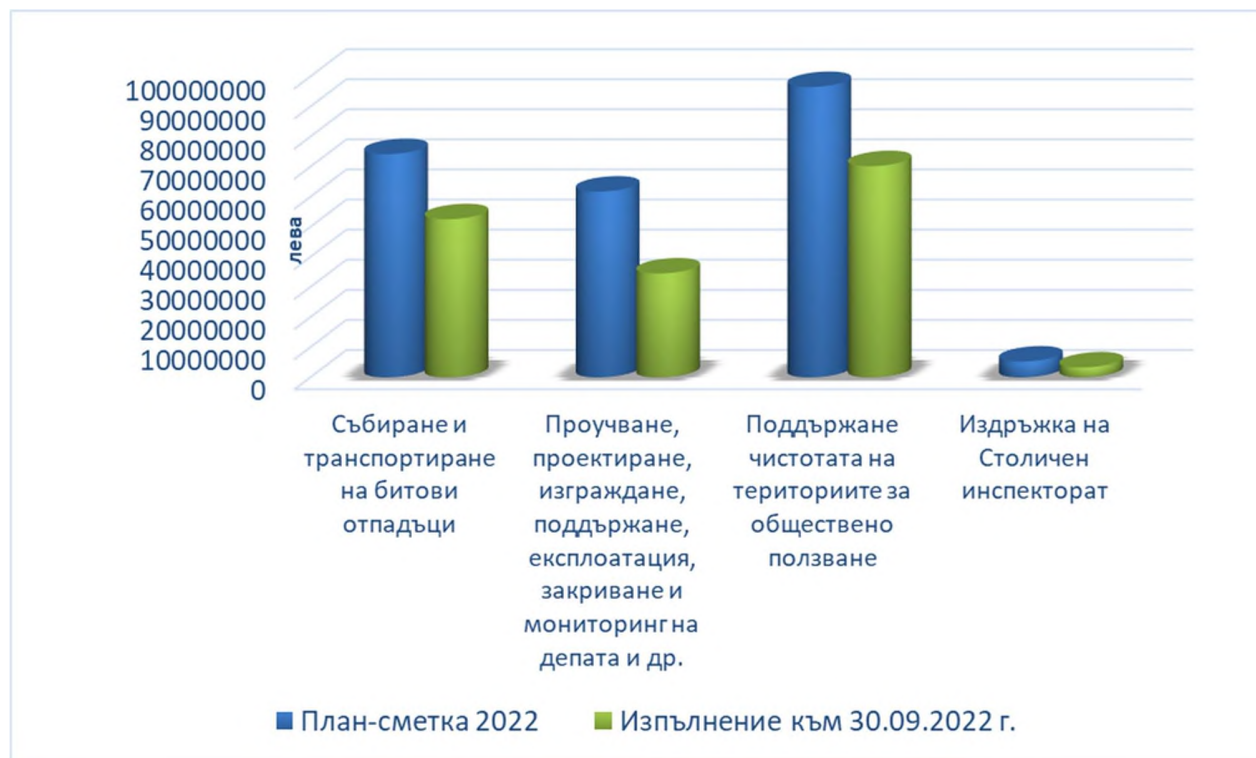
Фиг. 2. Изпълнение на план-сметката на Столична община за 2022 г. към 30.09.2022 г.

Изпълнението на разходите към 30.09.2022 г. е представено подробно в Приложение №1.