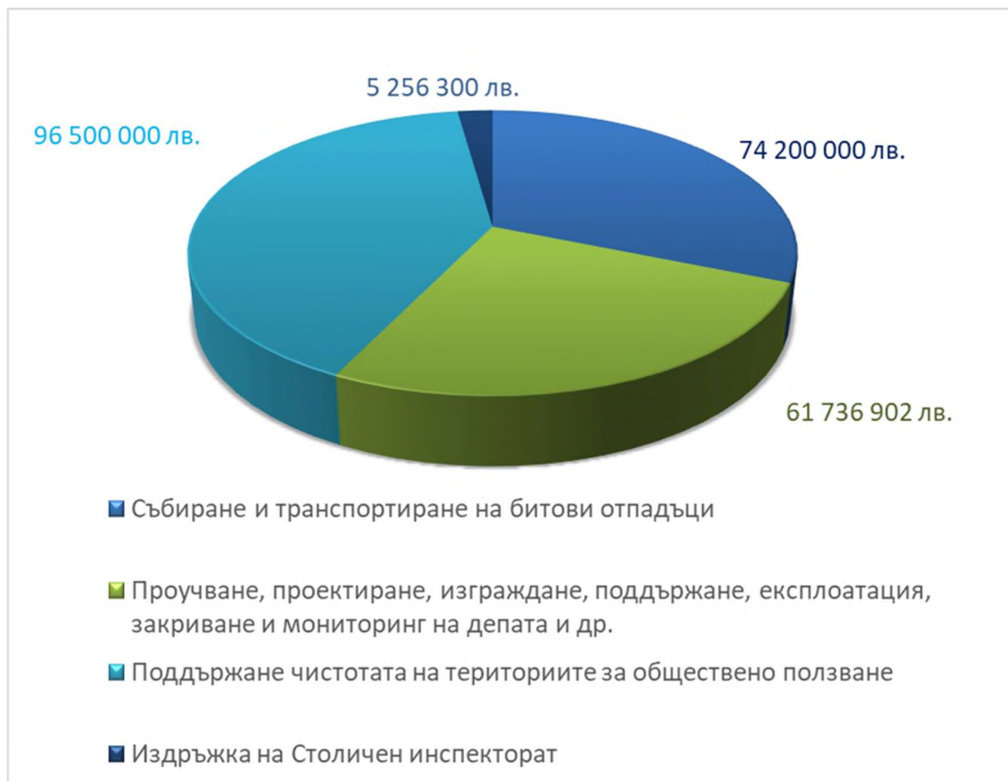
Фиг. 1. План-сметка на Столична община за 2022 г. по компоненти.

проучване, проектиране и изграждане на нови съоръжения, предварително третиране, обезвреждане, както и за поддържане чистотата на териториите за обществено ползване, възлизат на 237 693 202 лв. Средствата за поддържане на чистотата на териториите за обществено ползване са планирани в размер на 96 500 000 лв. Средствата, определени за дейностите по събиране и транспортиране на битовите отпадъци, са в размер на 74 200 000 лв. Разходите за проучване, проектиране, изграждане, поддържане, експлоатация, закриване и мониторинг на депата за битови отпадъци или други инсталации или съоръжения за обезвреждане, рециклиране и оползотворяване на битови отпадъци, включително отчисленията по чл.60 и 64 от ЗУО, са планирани в размер на 61 736 902 лв. Издръжката на Столичен инспекторат, включена в план-сметката за 2022 г., е в размер на 5 256 300 лв. Разпределението на средствата по основните дейности е показано на фигурата по-долу.