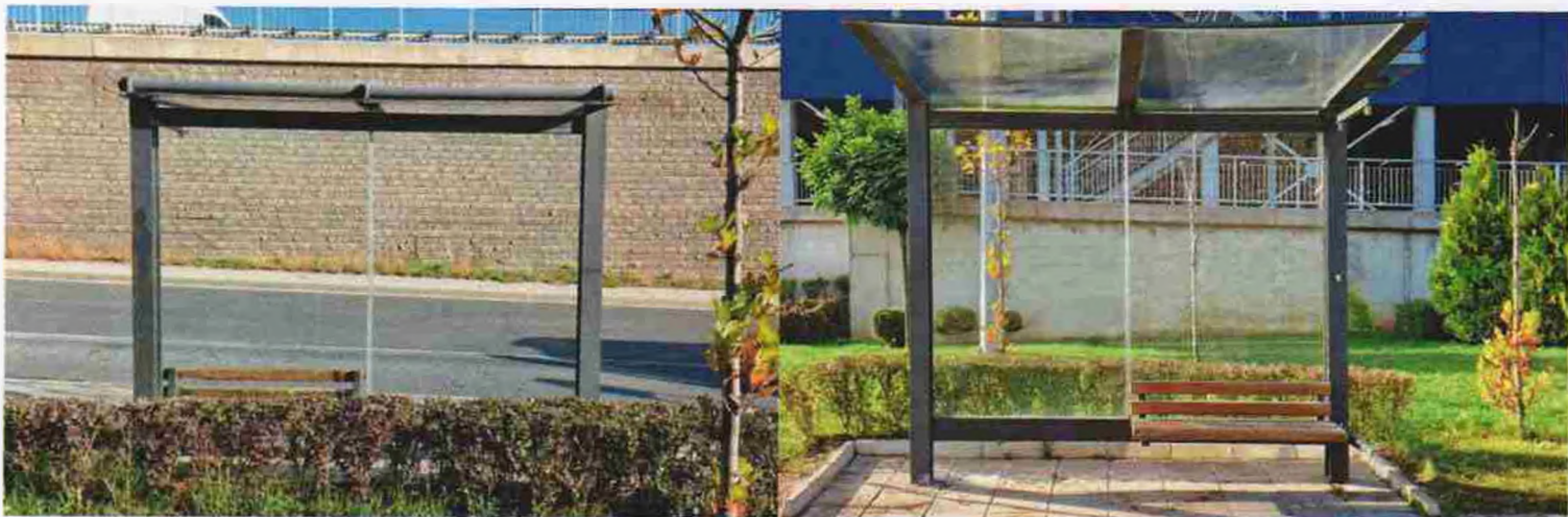
(спирка с код № 0865. „ул. Бистришко шосе“)

„Център за градска мобилност“ ЕАД използва като основа Общинския типов проект и изработва два Варианта на преработени и допълнени типови проекта за спирков навес, съответно с дължина 3 м и 4,5 м. Проектите за двата Варианта са внесени за утвърждаване в Направление „Архитектура и градоустройство“ (НАГ) на Столична община на 12.01.2021 г. и същите са утвърдени на 08.06.2021 г. По време на текущата процедура за одобрението на проекта за двата типови навеса „Център за градска мобилност“ ЕАД стартира изработка на пилотни такива по проекта Вариант 1 (3 м.). След одобрението на Типовите проекти от НАГ през юни 2021 г. е стартирала процедура за монтиране на спирконавесите на конкретни спирки: