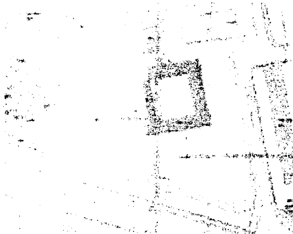
УПИ III-за полухайлика, кв.83А център XXIV м.„Надежда-Връбница I“

Сградата на ДКЦ XXIV, се намира в гр.София, на улица „Ген.Никола Желазов“ № 3, Район „Надежда“-СО. Сградата е построена върху УПИ III-за полухайлика, кв.83, по плана на гр.София, местност „Надежда-Връбница I“, кв.ж.к.„Свобода“, непосредствено до Северния парк на гр.София.